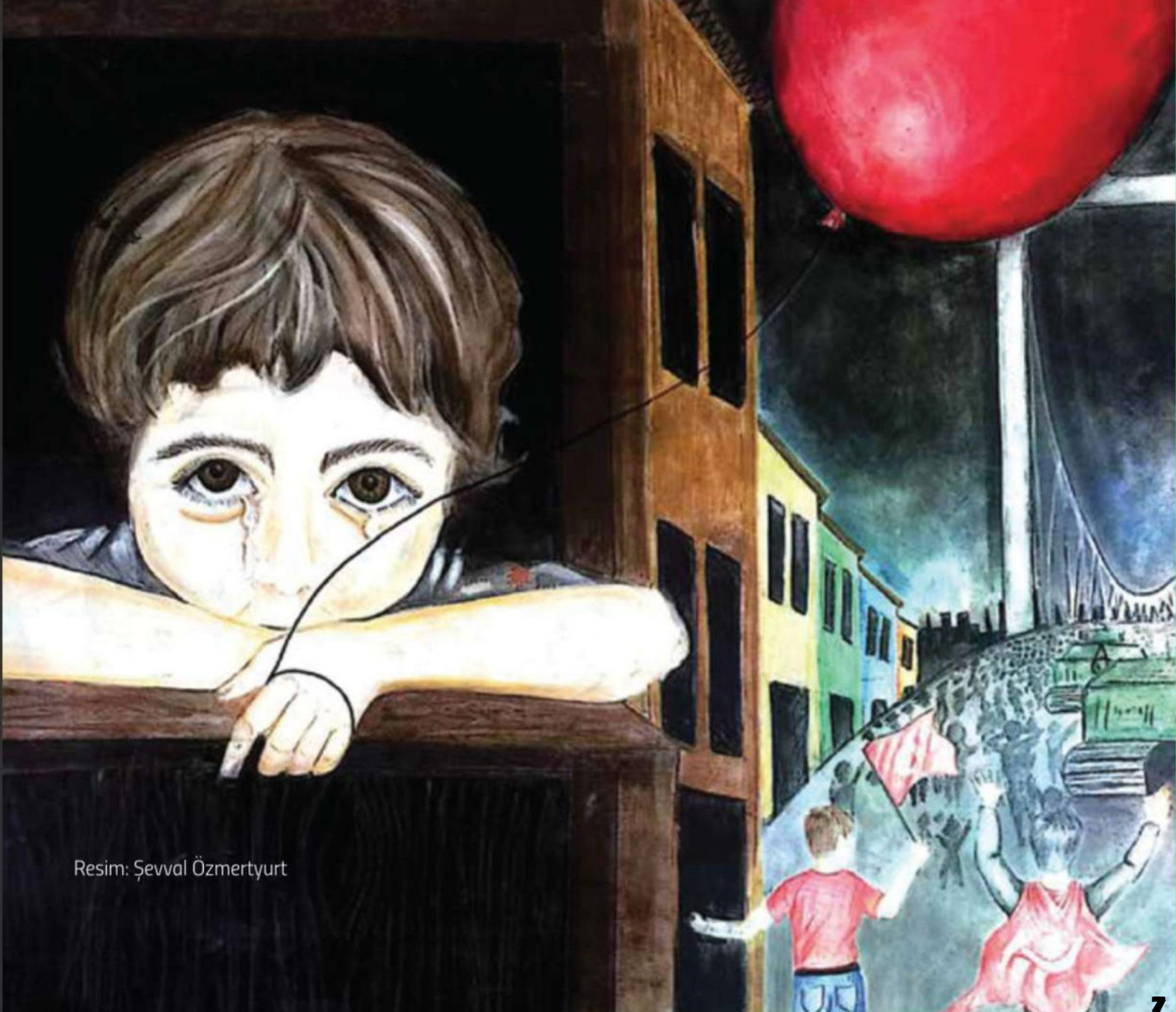
Resim: Şeval Özmertyurt

Zeynep uykuya dalmıştı dalmasına ama dışarıdan gelen bir ses onu bu ağır uykusundan uyandırmıştı. Sanki biri şarkı söylüyor gibiydi. Ki Zeynep bunu çok önemsemeyip tekrar tatlı uykusuna dalacaktı. Ama o sırada çarpan kapı sesi buna engel oldu.